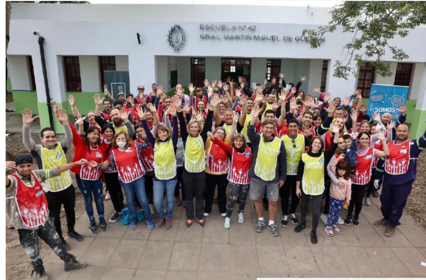
ESCUELA N° 42 GRAL MARTIN MIGUEL DE GÜEMES